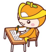
所沢市イメージマスコット トコロん